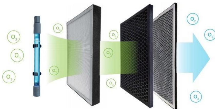
UVC HEPA 滤网 活性炭+化学滤材